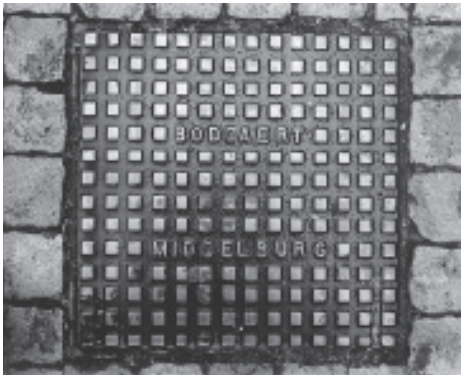
Het putdeksel van Boddaert in de Herenstraat, ter hoogte van de Kleine Herenstraat.

Dat er putdeksels van Boddaert in Middelburg lagen, wist Jilleba niet. In grote series kunnen die volgens hem niet zijn gemaakt. Dat maakt deze deksels juist zo bijzonder. Twee heb ik er, zonder gericht te zoeken,