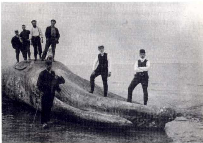
De bij Burgh op Schouwen aangespoelde vinvis ligt op het strand van Vrouwenpolder om ontleed te worden, 1910.

Helaas waren krantefoto's in die tijd nog niet zo in zwang, maar het moet een fantastisch gezicht zijn geweest. Op zondag 28 februari meldde de Nieuwe Rotterdamse Courant de reis van de potvissen en