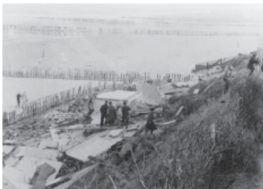
De in 1952 langs het duin van Domburg gebouwde badcabines en het cafeetje met terras werden door de storm volledig weggeslagen.