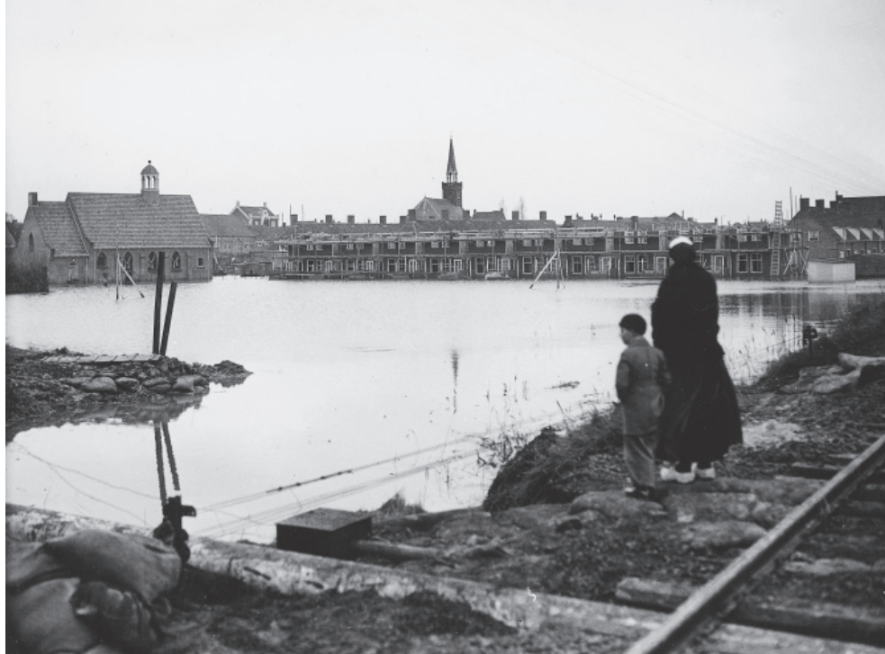
Moeder en zoon bekijken vanaf de spoorbaan het onder water gelopen gedeelte van Arnemuïden (spoorwegovergang Schuttershof-Singel).