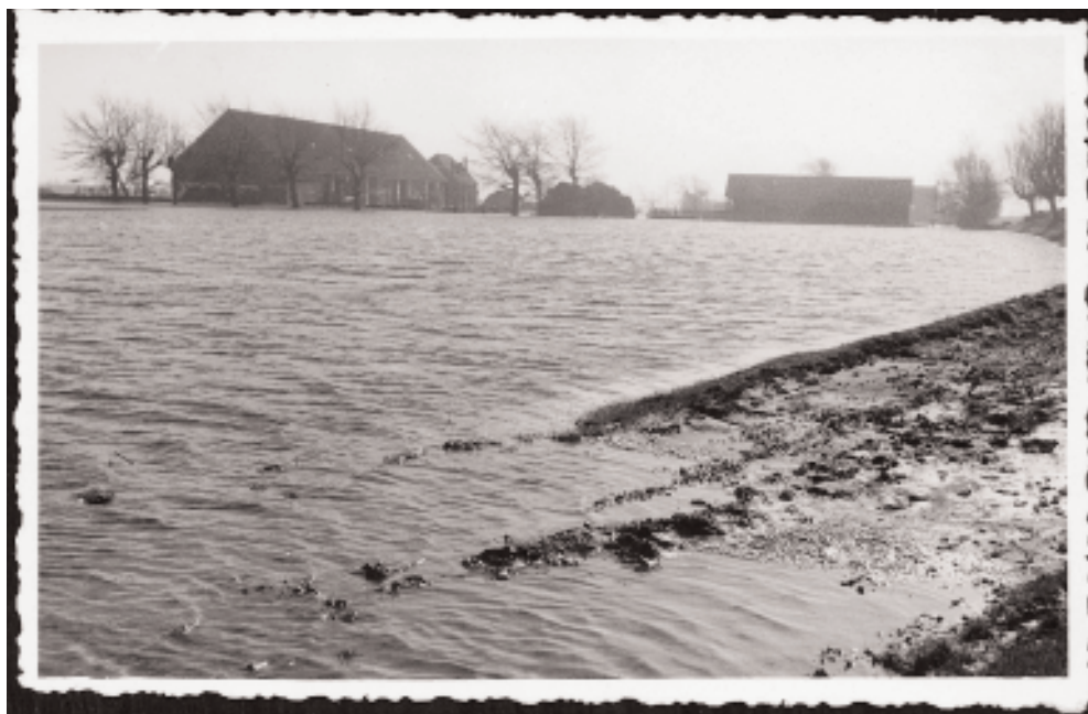
De Wete jaargang 32 nummer 1 (januari 2003) / Heemkundige Kring Walcheren ( www.hkwalcheren.nl )