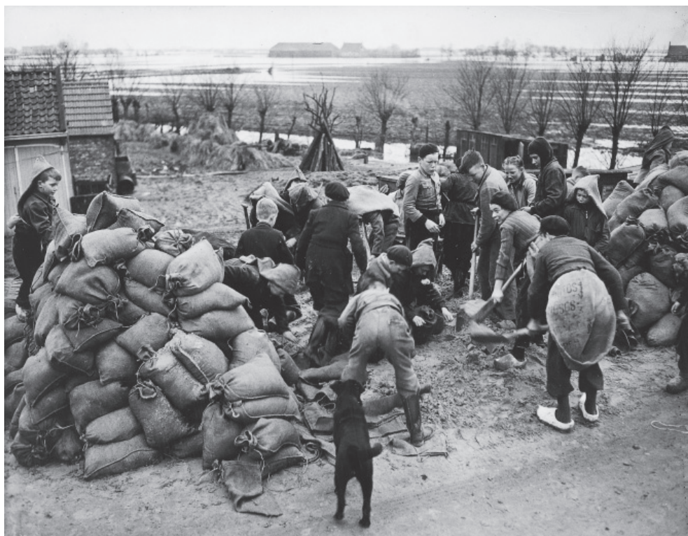
Kinderen van de openbare school van Arnemuïden aan het werk op de Poldersedijk met het vullen van zakken met zand.